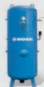
Reservatório de ar comprimido