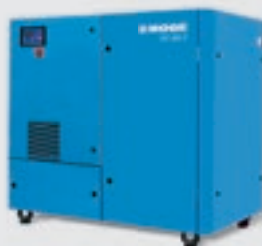
Compressor de parafuso