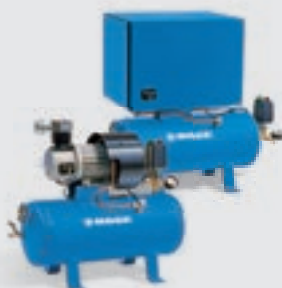
Compressores de pistão

Potência do motor: 3 – 7,5 kW Débito: 0,28 – 1,2 m 3 /min