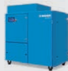
Compressor de parafuso com regulador de frequência e secador integrado