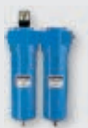
Filtro de ar comprimido