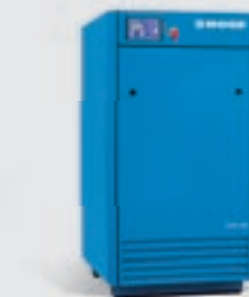
Compressor de pistão TOP AIR