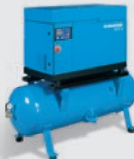
Compressor de parafuso com regulador de frequência