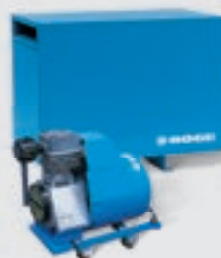
Compressores de pistão, sem óleo