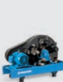
Compressores de pistão

Potência do motor: 11 – 37 kW Débito: 1,25 – 6,35 m 3 /min