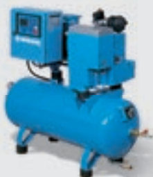
Compressor de parafuso com módulo compacto