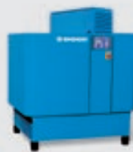
Compressores de parafuso com regulador de frequência