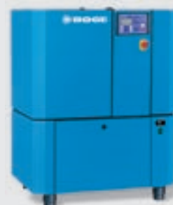
Compressor de parafuso com secador integrado