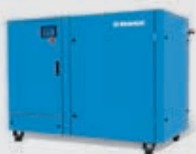
Compressor de parafuso

Potência do motor: 45 – 355 kW Débito: 5,36 – 43,7 m³/min