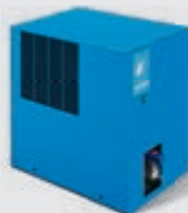
Secador de ar comprimido por refrigeração